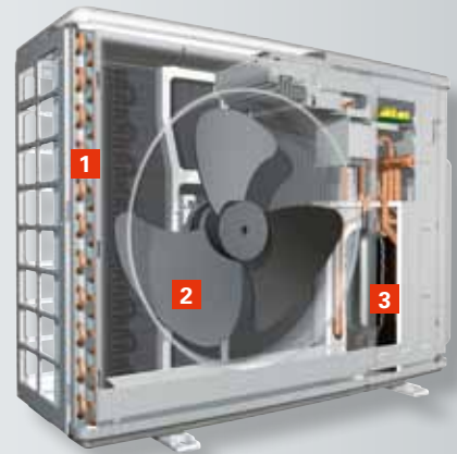
Vitocal 242-S/222-S Außeneinheit