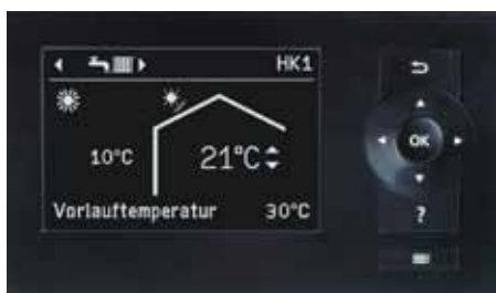
Display der Wärmepumpenregelung Vitotronic 200