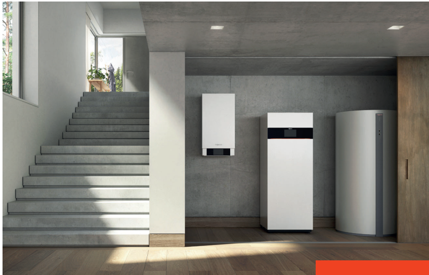
Brennstoffzelle Vitovalor PA2 in einer Anlage mit Gas-Brennwert-Wandgerät Vitodens 200-W und Heizwasser-Pufferspeicher Vitocell

Staatliche Förderung: bis zu 11.100,- Euro