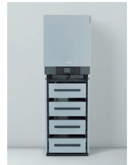
Sinnvolle Ergänzung: Vitocharge Stromspeicher- System