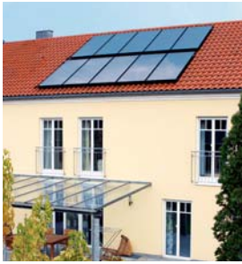
Vitosol 200-F Zweifamilienhaus Geisenfeld

Leistungsstarke und langlebige Flachkollektoren zum attraktiven Preis. Der Vitosol 200-F ist von der Stiftung Warentest mit „sehr gut“ bewertet worden!