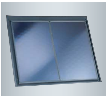
Der Großflächenkollektor Vitosol 200-F, Typ 5DIA ist mit einer 4,75 m 2 großen Absorberfläche erhältlich.